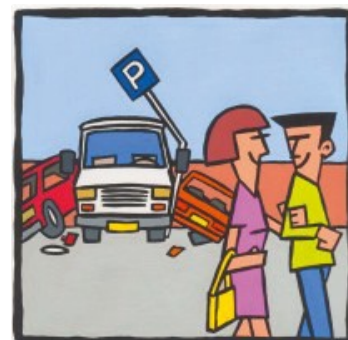
Parkeer en manoeuvreer schade

Voor voertuigen tot 3.500 kg geldt een eigen risico van € 1500,- excl. btw (art. 14.1).